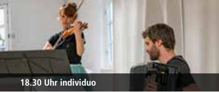
18.30 Uhr Individuo