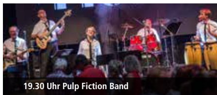
19.30 Uhr Pulp Fiction Band