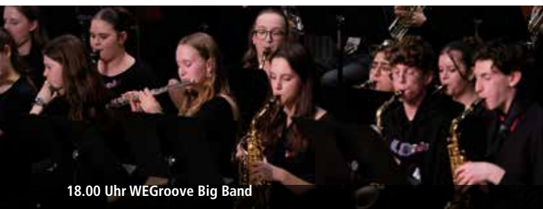
18.00 Uhr WEGroove Big Band

Das aktuelle Programm zum Bürgerfest auch unter: www.buergerfest-schwabach.de