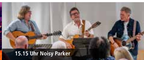
15.15 Uhr Noisy Parker