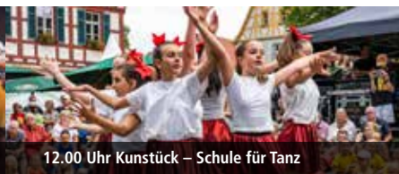
12.00 Uhr Kunststück – Schule für Tanz