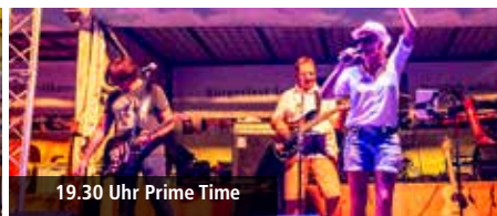
19.30 Uhr Prime Time