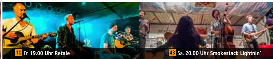
10 Fr. 19.00 Uhr Retale