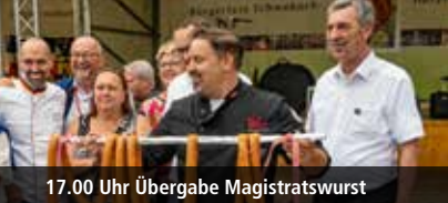
17.00 Uhr Übergabe Magistratswurst