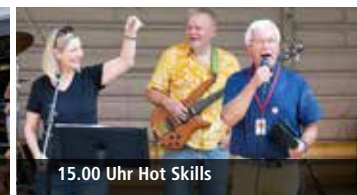
15.00 Uhr Hot Skills