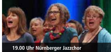
19.00 Uhr Nürnberger Jazzchor