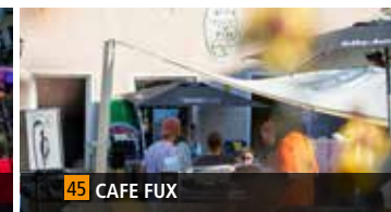
45 CAFE FUX