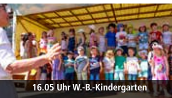
16.05 Uhr W.-B.-Kindergarten