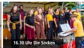
16.30 Uhr Die Socken